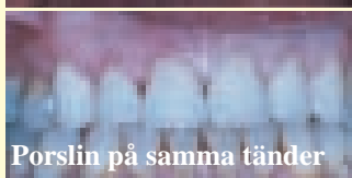
Porslin på samma tänder